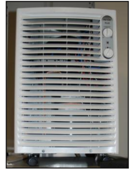
▲ Déshumidificateur par refroidissement