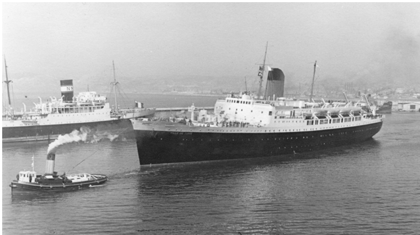
Ville De Tunis croisant un paquebot de la Compagnie de Navigation Mixte

sur le pont. Les repas ne sont pas compris, à eux d'emporter de quoi se nourrir, des boîtes de conserve en général. La traversée est assez rapide, elle s'effectue en 18 heures néanmoins la situation à bord doit se compliquer lorsque le mauvais temps s'invite. Le moindre mètre carré couvert est alors occupé. Ces conditions matérielles ne sont qu'un aspect des choses. Dans le coeur de chaque rapatrié des sentiments partagés se succèdent. La satisfaction de quitter sain et sauf un pays en guerre tout d'abord, mais également, la tristesse de s'éloigner de son pays natal et l'appréhension de l'accueil de la métropole, qu'une grande partie ne connaît pas.