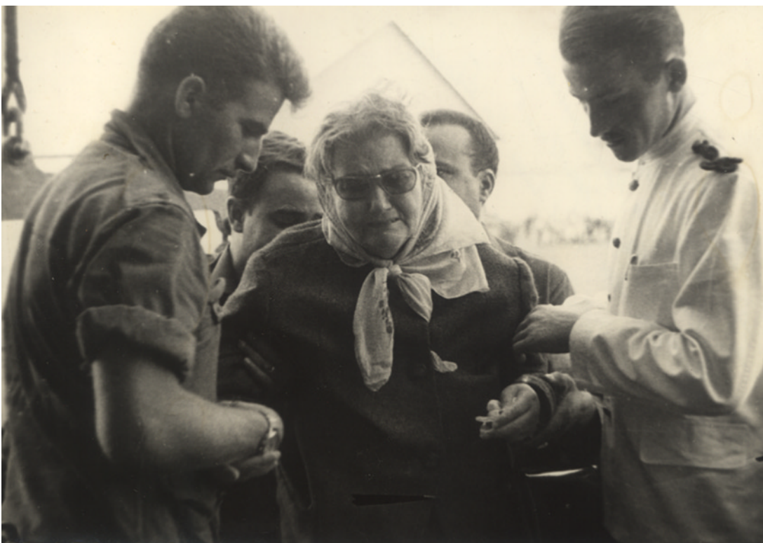
La douleur du départ

D'ores et déjà, merci pour votre aide et votre engagement en faveur de ce projet !