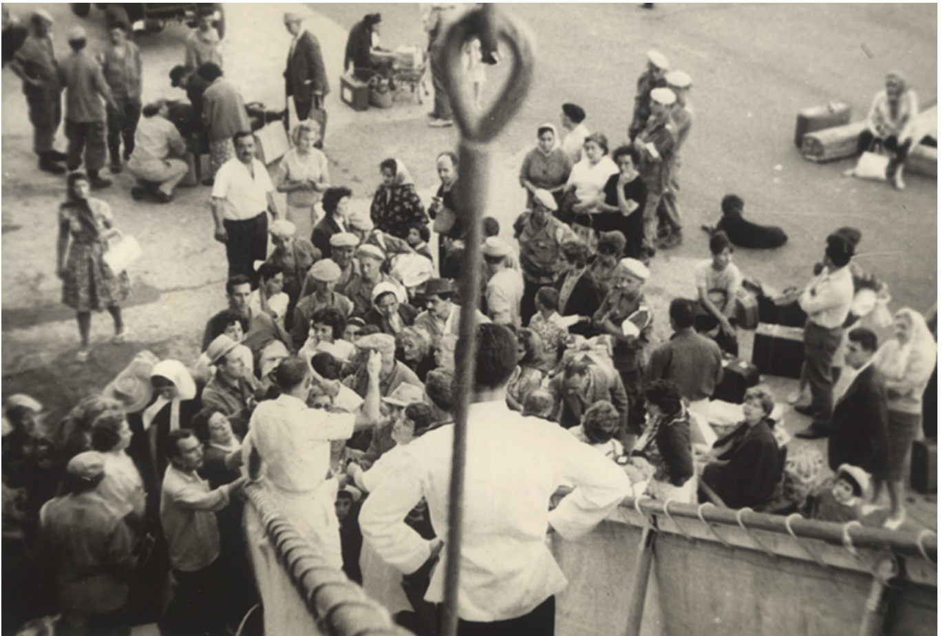
File d'attente avant embarquement

A l'armement, dans les agences, sur les ponts et dans les ports, la précipitation est à son comble. Les telex pleuvent. Il faut trouver des navires. Les principales compagnies sur cette ligne : la Compagnie Générale Transatlantique, la Compagnie de Navigation Mixte, la Société Générale de Transport Maritime à Vapeur accélèrent les rotations et mettent de nouveaux navires. Ainsi, Ville d'Alger, Ville d'Oran, Ville de Bordeaux, Ville de Tunis, Charles Plumier, El Mansour, Djebel Dira, Djebel Amour, Sidi Mabrouk, Djenné